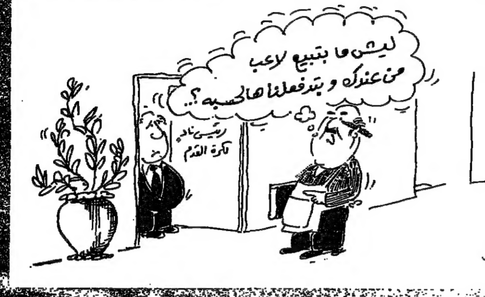
ليكن ما يتبعه لاعب من عنكره وبتفعلنا هاحسبه ؟

عبد الحفيظ وثار السيد الرياضي « دولي » سن ١٩١ جودقي في بنك مصر لبنان بسدا ممارسة كرة الصلة عام ١٩٦٦ بقيادة الرياضي اعزب رايه بالاديين اللبنانيين : تزيهم الفكرة والتدريب وتكثفهم جيبون رايه بالاديين : سع كورين رايه بالحكم : شخصيتهم ضعيفة رايه بالاحاد : رف كوره وحشول : ابنه : ان اتركه للعبة وقد تركها وتلقى مزجج لاسي مجاب :